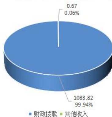
收入总体情况示意图（单位：万元）

本年收入合计 1084.49 万元，其中：财政拨款收入 1083.82 万元，占 99.94%；上级补助收入 0 万元，占 0%；事业收入 0 万元，占 0%；经营收入 0 万元，占 0%；附属单位上缴收入 0 万元，占 0%；其他收入 0.67 万元，占 0.06%。