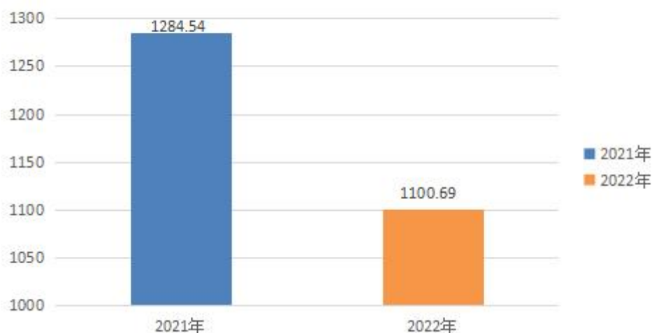
收入支出总计变化情况（单位：万元）

2021 年度收、支总计 1100.69 万元。与 2020 年度相比，收、支总计各减少 183.85 万元，下降 16.7%。主要是疫情原因学校各项活动减少，收支相应减少。