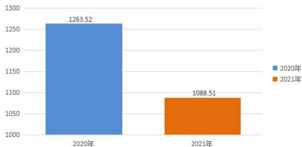
一般公共预算财政拨款支出示意图（单位：万元）

2021 年度一般公共预算财政拨款支出 1088.51 万元，占本年支出合计的 98.95%。与 2020 年度相比，一般公共预算财政拨款支出减少 175.01 万元，下降 16.46%。主要是疫情原因各项活动减少。