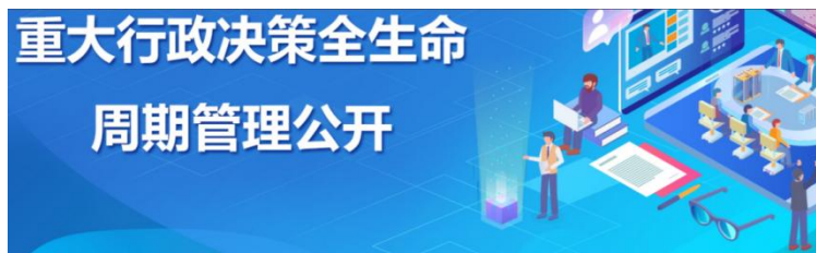
重大行政决策事项目录

个公开政策意见征集、决策会议、决策文件、决策解读等，实现全流程可视化公开；推进会议公开，严格落实利益相关方列席政府会议制度，今年以来邀请群众代表列席 5 次，主动公开政府常务会议 19 次、全体会议 1 次和专题会议 4 次。深化管理和服务公开，继续推进权责清单、行政